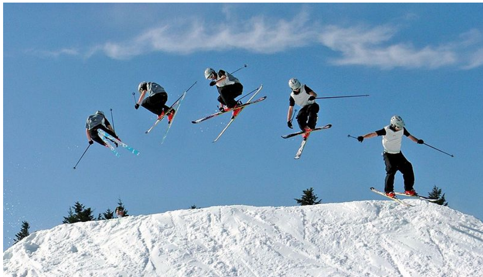
FIGURE 1 – Figure de style d'un skieur sur une piste enneigée.

Voici une image tirée de wikipédia (à défaut de pouvoir manipuler avec vous en cours) :